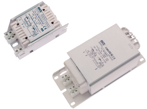
Format 2 Formato 2